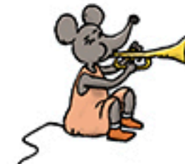
1 souris trompettiste