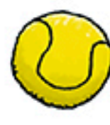
3 balles de tennis