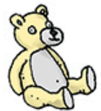
1 doudou « Ours » jaune