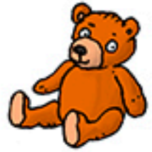
5 doudous « Ours » orange