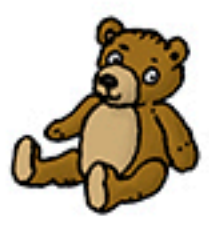
3 doudous « Ours » bruns