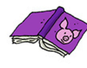
1 livre violet

Un chevreau manque à l'appel ! Sauras-tu retrouver lequel ?