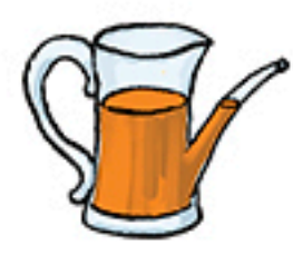
1 pichet de jus de carotte