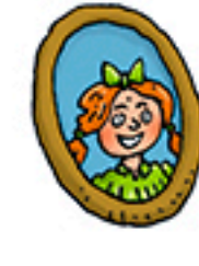
1 joli cadre