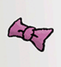
1 petit nœud rose