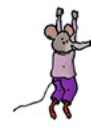
1 souris en train d'escalader