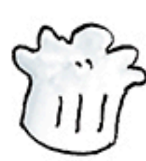
1 toque de cuisinier