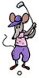
1 souris qui joue au golf