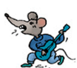
1 souris guitariste