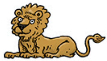
1 statue de lion