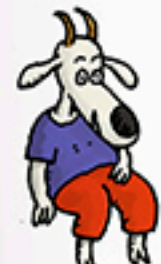
1 doudou « Chevreau »