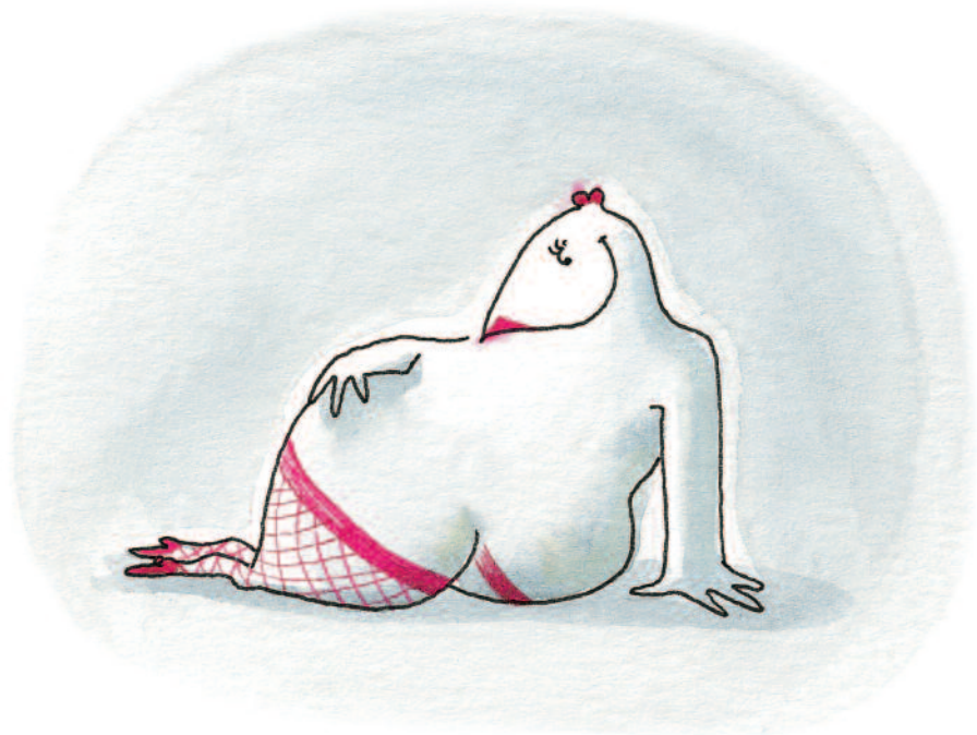
Lulu était une belle poule dodue, très coquette.