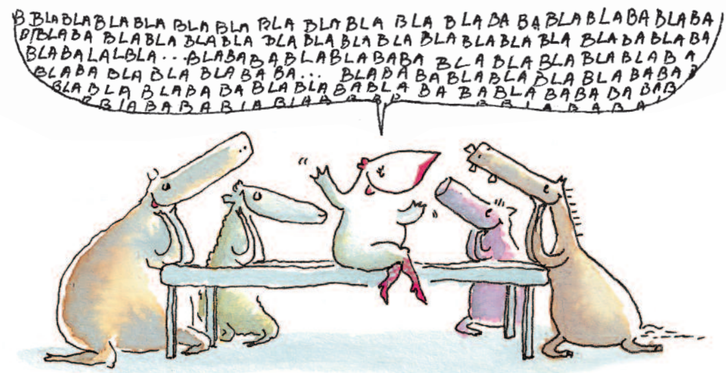
De caractère affable, elle avait toujours quelque chose à raconter.