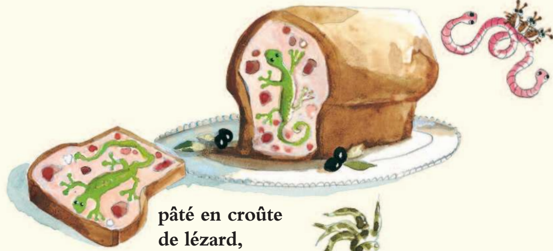
pâté en croûte de lézard,