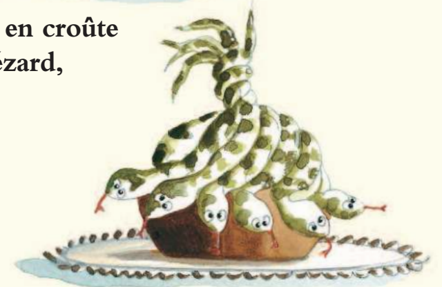
tourte de serpents fumés,