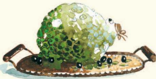
Soufflé de crapaud,