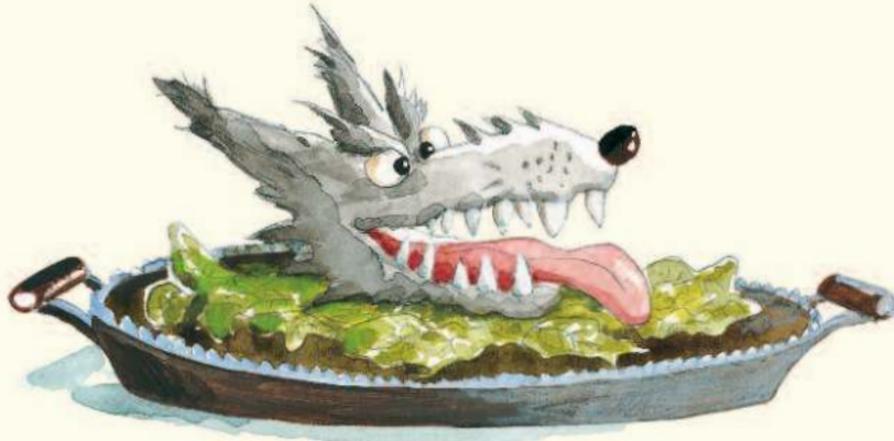
langue de loup aux choux,