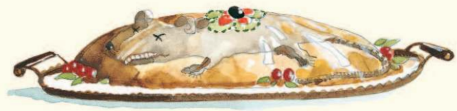
rat en gelée...

Elle prépare des mets rares, des mets raffinés.