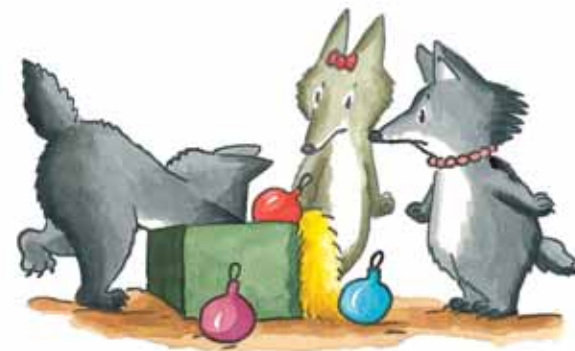
Loulou est énervé.