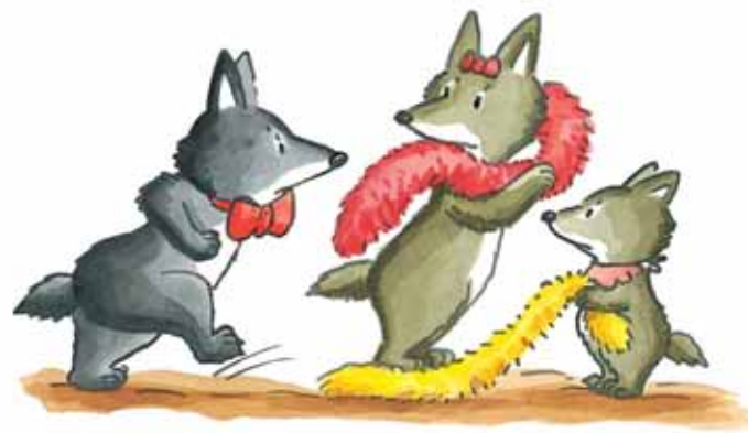
Il tape du pied.