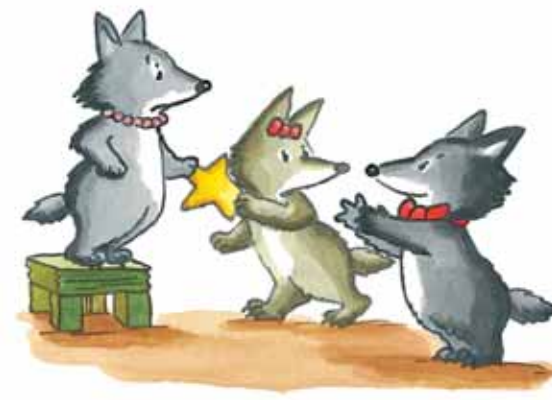
Il bat des pattes.