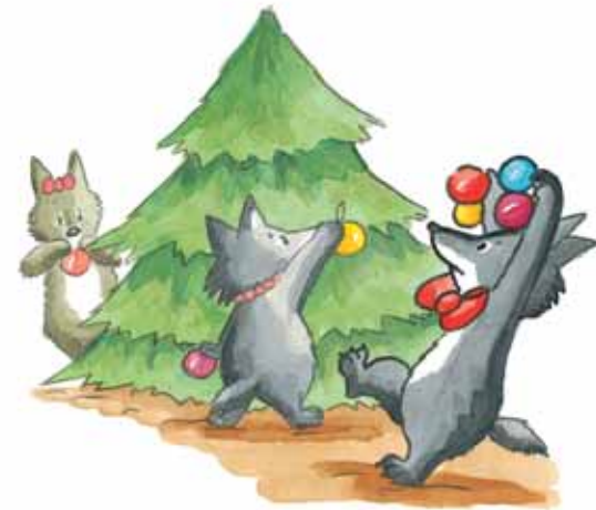
Il saute sur place.