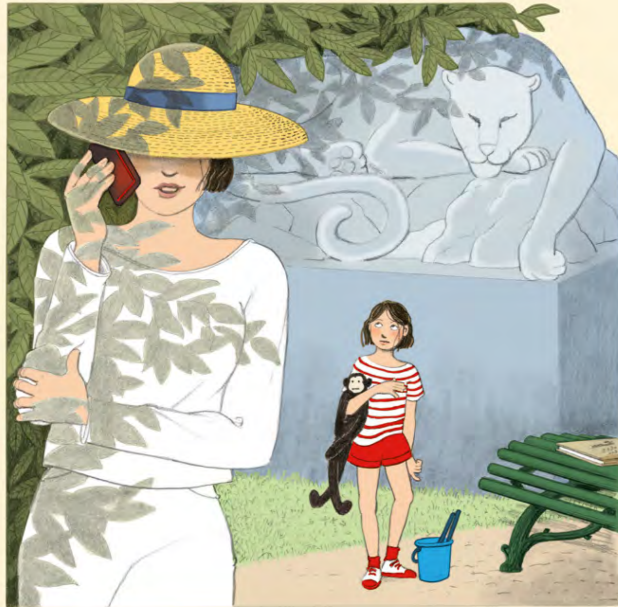
– Maman, dit Norma, j'ai secoué Jojo, on t'attend!