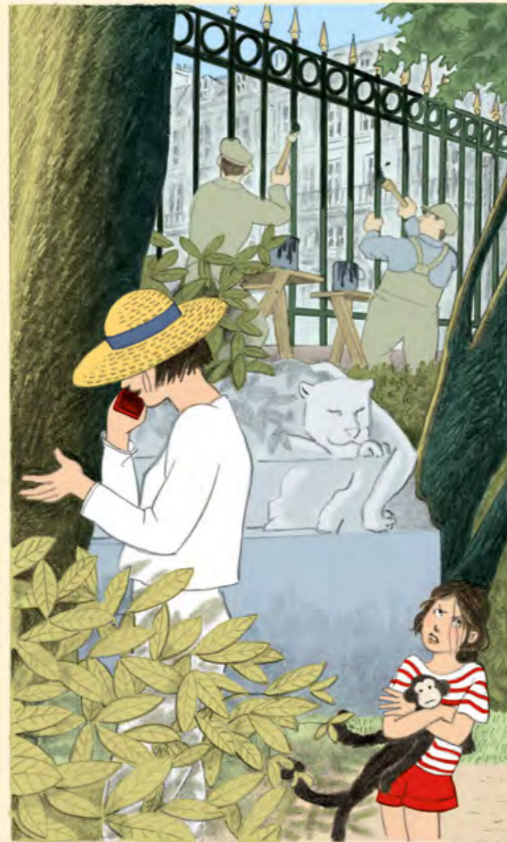
Maman-maman-maman-maman-maman- maman-maman-maman-maman-maman- maman-maman-maman-maman-maman...