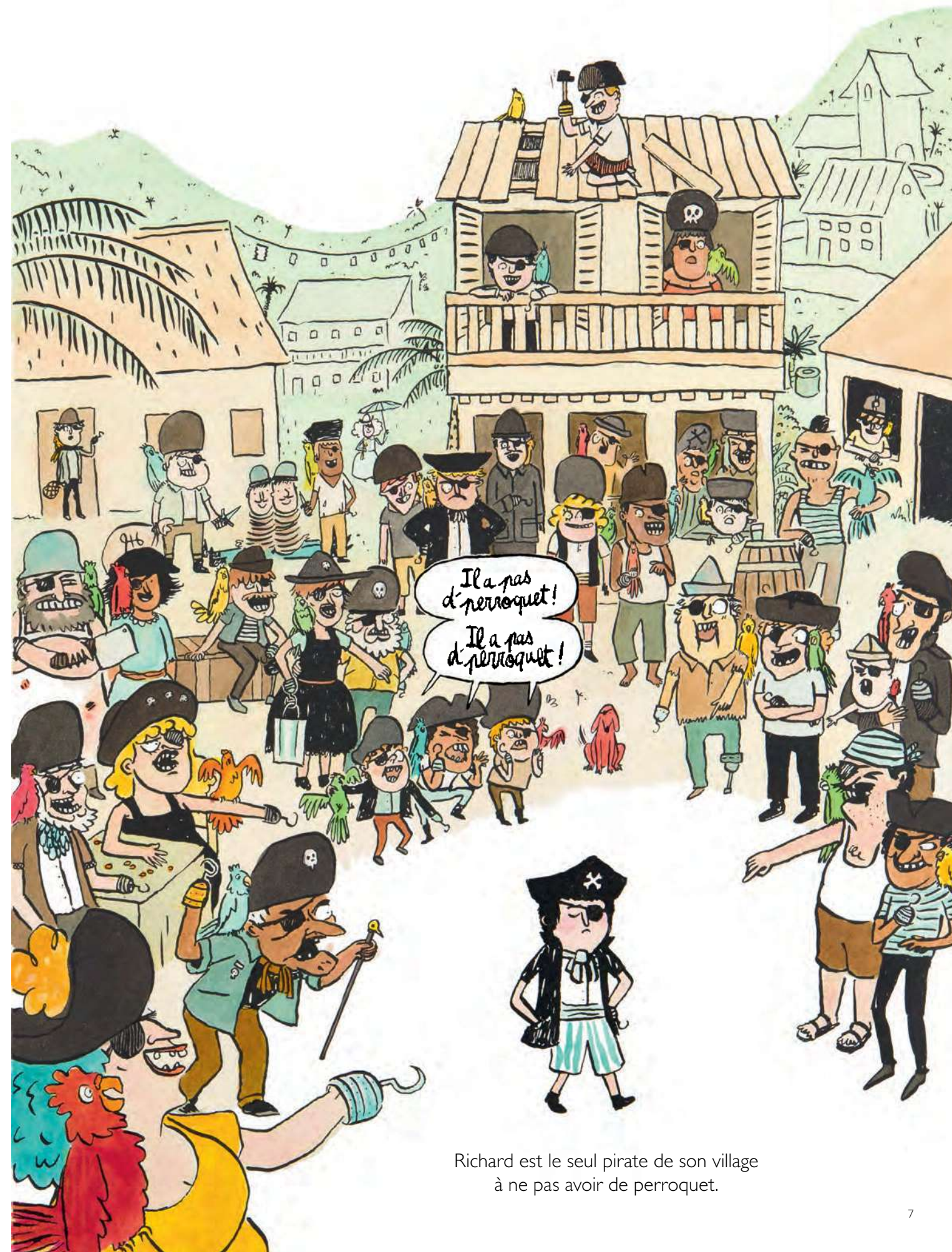
Richard est le seul pirate de son village à ne pas avoir de perroquet.