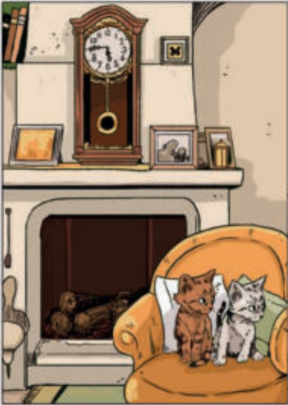
UN MATIN COMME LES AUTRES MATINS...