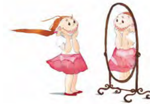
La princesse coquette page 9