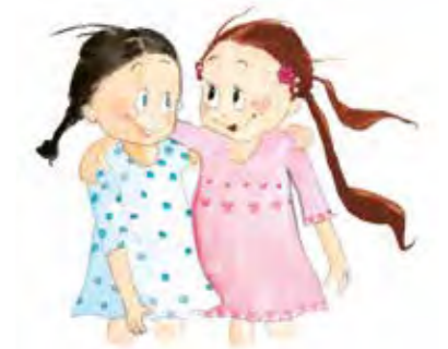
Princesse copine-en-chef page 61