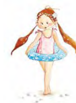
L'autre princesse page 119