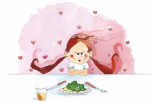
Mademoiselle princesse ne veut pas manger page 35