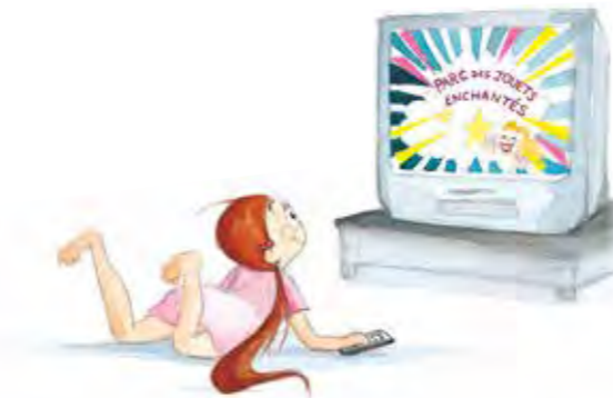
La princesse réclame page 87